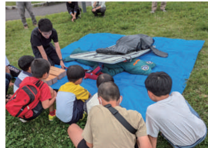
▲子ども達も一生懸命! 瓦礫から無事救出!

「防災」という世代を問わないテーマを軸に、住民同士がつながるきっかけや、多世代交流のきっかけにもなる区会防災訓練でした。