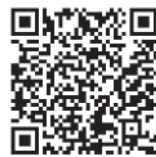
▲参加申し込み用フォーム