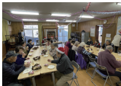
▲ほっとひと段落でおしゃべりタイム