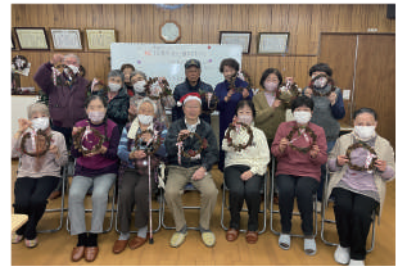
▲協力し合いながらクリスマスリースを作りました。

イベントでは、クリスマスリースづくりが行われ、どんぐりや松ぼっくり、リボンなど装飾に使える物が多数用意されて、皆さん思い思いのリースを作っていました。お互いに声をかけ合い、協力しながらクリスマスリースづくりを行った後は、クリスマスケーキを食べながら思い出話に花を咲かせていました。