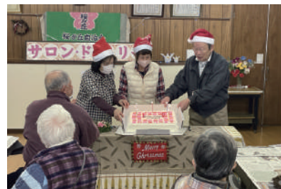
▲特別なケーキも用意されていました!

を目指してきた。設立10周年と開催100回目を迎えられたのは、地域の皆さんに支えられ、自治会や社協からの支援があったこと。これからも皆さんと一緒に楽しく生きがいのある生活を続けられるようにしていきたい」と話されていました。